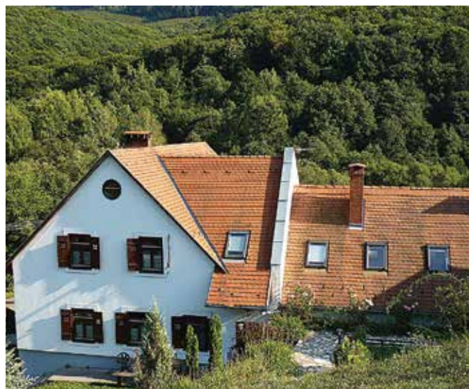
Az Életrendezés Háza

A mobil programok másik fajtája a hétköznapokban is végezhető lelkigyakorlat különleges formája, a Kísért imádság hete . A résztvevők egy közös nyitó alkalom után minden nap személyesen imádkoznak egy-egy órát, és találkoznak lelki kísérőjükkel. Emellett folytatják hétköznapi életüket, munkába járnak, tanulnak, gyermeket nevelnek. Ez a lelkigyakorlatos forma, melynek általában egy-egy plébánia szokott helyet biztosítani, ideális